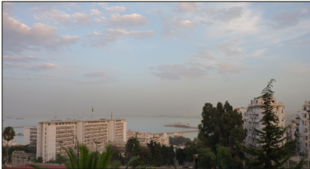
Ill. 2 : Vue sur mer depuis la Bibliothèque nationale d'Algérie, site Frantz Fanon, 2024

Enfin, il est utile de se rendre en maints lieux qui restent inexplorés par la recherche. Toutes les wilayas sont dotées d'un centre d'archives, dont certains hérités de la période coloniale[1]. Un passage au service d'archives de la wilaya de Mostaganem a par exemple permis de constater l'existence d'un fonds rassemblant des documents très hétéroclites pour la période 1938-1975 (138 articles) ; un autre est relatif aux internés de la région (classement alphabétique d'individus). Des fonds ont aussi été déplacés vers les Archives nationales. Il est également possible de se rendre dans les mairies[2], les mosquées, les universités (dont les instituts de bibliothéconomie, qui produisent des travaux sur les archives), les centres de recherche (sur les forêts, sur l'agriculture, etc.), les institutions publiques ou parapubliques (chemins de fer, radio, etc.).