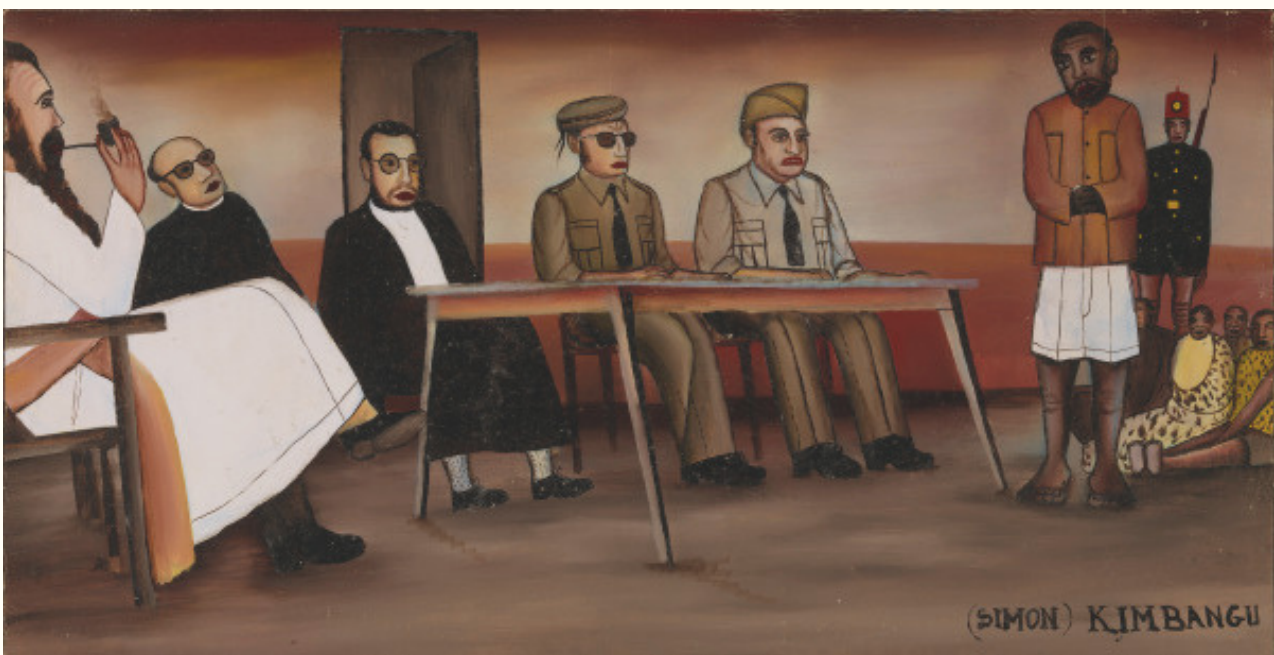
« (Simon) Kimbangu », par Tshibumba Kanda Matulu, ca. 1970-1973. Procès de Simon Kimbangu devant la cour martiale, 1921. Virginia Museum of Fine Arts

S’appuyant sur la collaboration entre la science du patrimoine et l’expertise universitaire, ce projet s’inscrit dans les débats politiques et historiographiques autour du patrimoine controversé des archives coloniales belges et de l’histoire violente de l’impérialisme belge. À la suite de la redécouverte d’une collection longtemps considérée comme perdue, comprenant plus de 5 400 dossiers judiciaires couvrant 70 ans de témoignages sur les crimes militaires coloniaux, DIGICOLJUST-2 ambitionne d’apporter un nouvel éclairage sur le déploiement et l’intensification de la violence armée en Afrique centrale coloniale (c’est-à-dire la « substance » de cette violence), ainsi que sur la relation complexe entretenue par les autorités coloniales belges – notamment militaires – avec l’impunité et les comportements abusifs des soldats (représentant le « mécontentement » suscité par cette violence, reflété dans les procédures judiciaires).